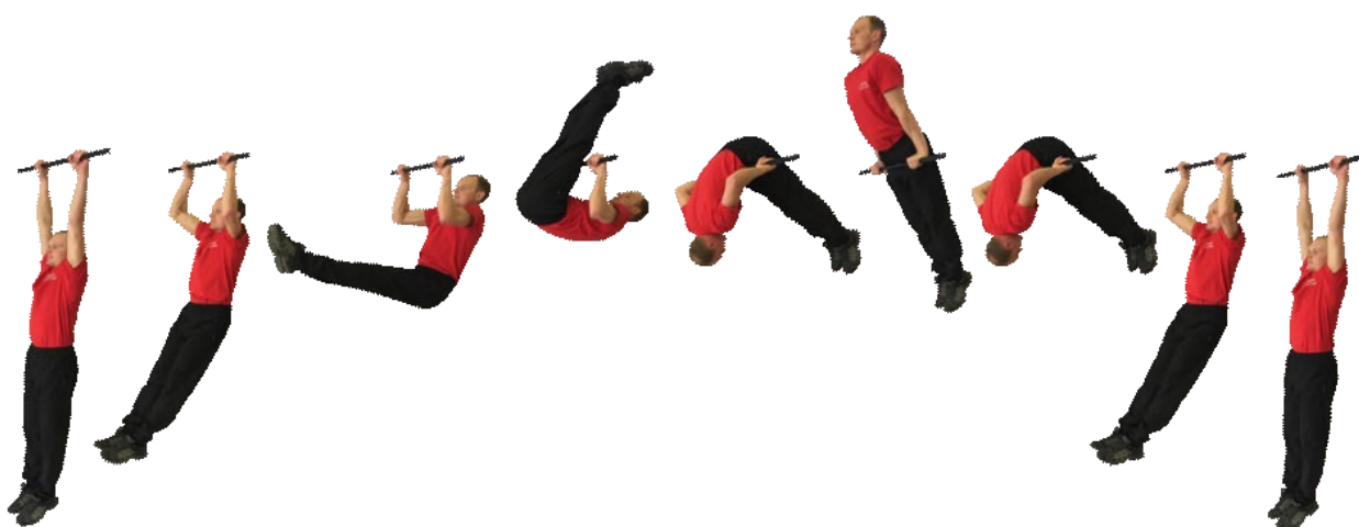
Рис. 2. Подъем переворотом на перекладине