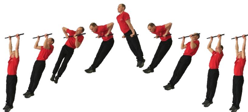
Рис. 3. Подъем силой на перекладине