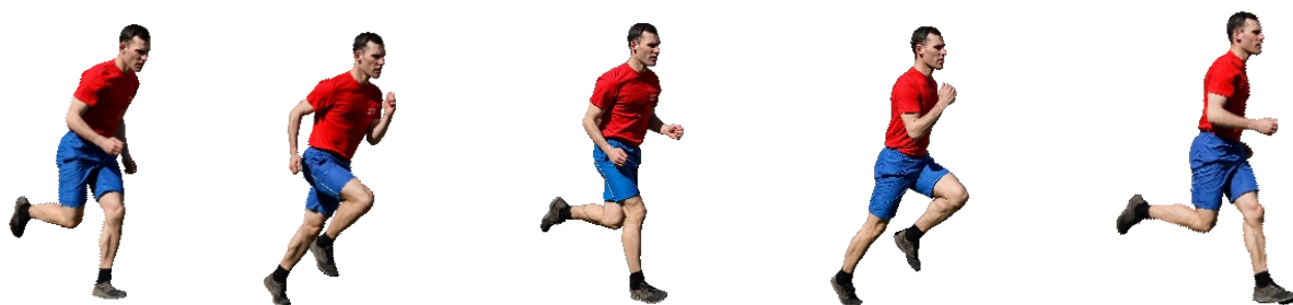
Рис. 5. Бег на 60 м, бег на 100 м