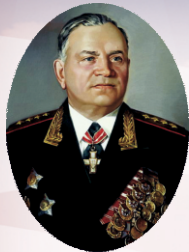
Генерал армии А.В. Хрулёв

Военная орденов Кутузова и Ленина академия материально-технического обеспечения имени генерала армии А.В. Хрулёва Министерства обороны Российской Федерации прошла большой и славный путь своего становления и развития. Она ведет свою историю с 31 марта 1900 года, когда в столице России – Петербурге впервые в мире было создано специальное военно-учебное заведение тыла – Интендантский Курс для подготовки офицеров и чиновников интендантского ведомства.