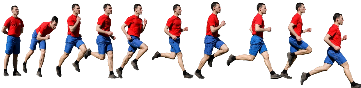
Рис. 7. Бег на 1 км, бег на 3 км.

Старт и финиш, как правило, оборудуются в одном месте. При выполнении упражнений на беговой дорожке стадиона старт и финиш производится в соответствии с разметкой стадиона.