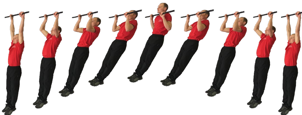
Рис. 1. Подтягивание на перекладине

При нарушении условий выполнения упражнения, повторение не засчитывается, подается команда «НЕ СЧИТАТЬ».