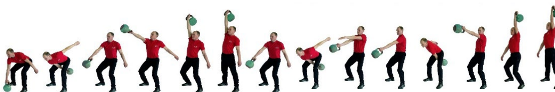
Рис. 4. Рывок гири

При нарушении условий выполнения упражнения повторение не засчитывается, подается команда «НЕ СЧИТАТЬ».