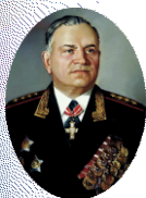
Генерал армии А.В. Хрулёв

Военная орденов Кутузова и Ленина академия материально-технического обеспечения имени генерала армии А.В. Хрулёва Министерства обороны Российской Федерации прошла большой и славный путь своего становления и развития. Она ведет свою историю с 31 марта 1900 года, когда в столице России – Петербурге впервые в мире было создано специальное военно-учебное заведение тыла – Интендантский Курс для подготовки офицеров и чиновников интендантского ведомства.